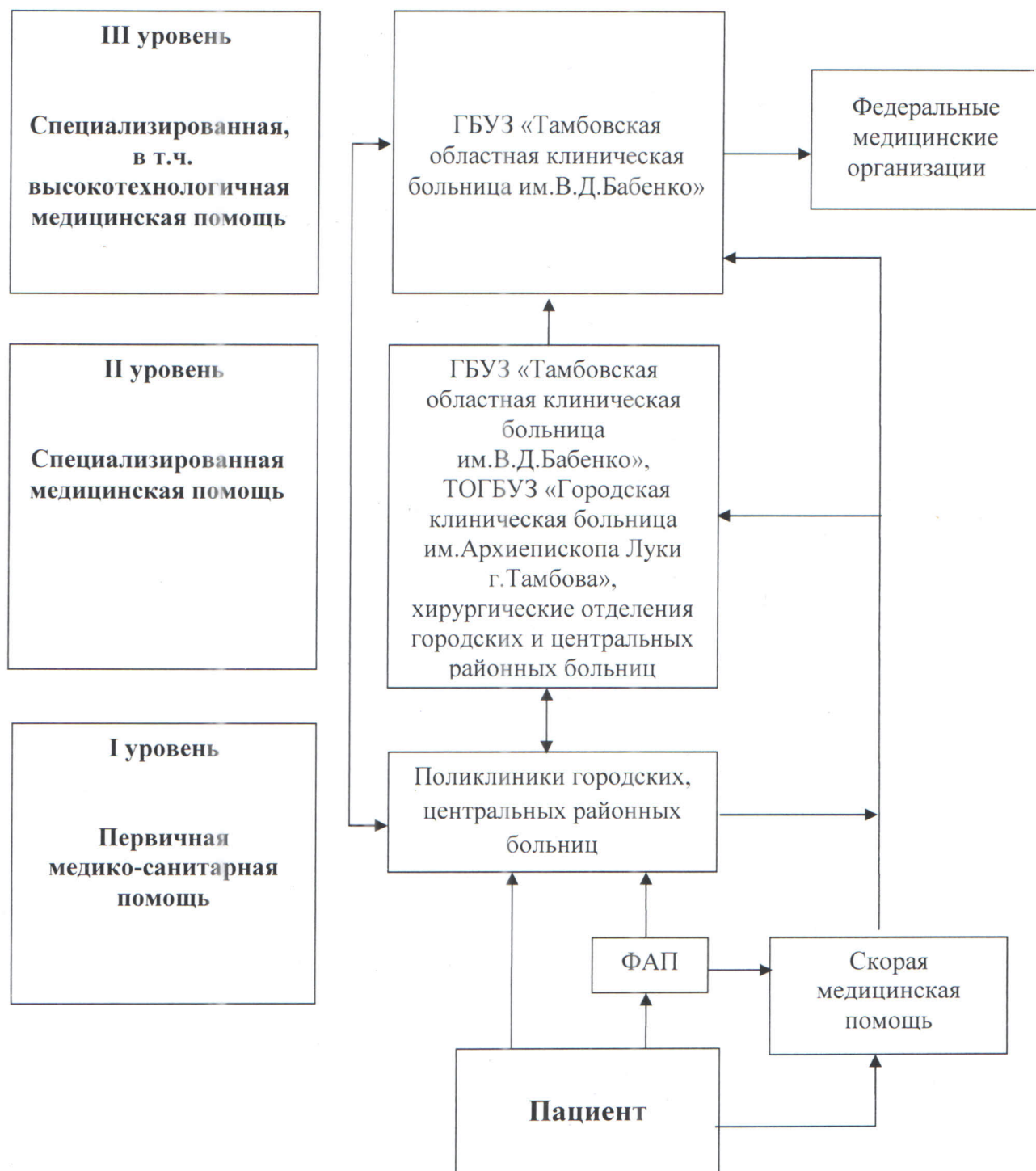
Схема маршрутизации пациентов при оказании медицинской помощи взрослому населению области по профилю «нейрохирургия»